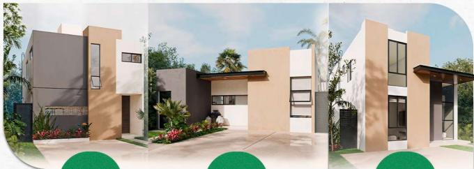
Modelo Bianca plus